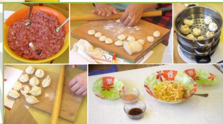
Workshop Mongolská kuchyně 14. 2. 2017