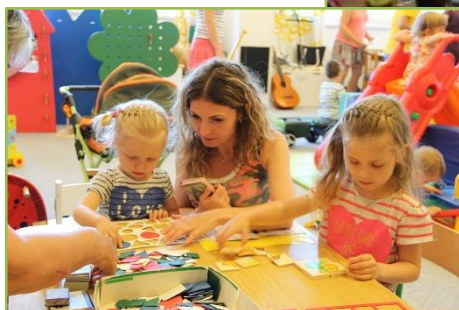
Den dětí 1. 6. 2017