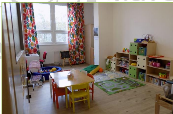
Prostor pro Mikrojesle

Tato aktivita se bude prolínat celým průběhem realizace projektu. Spolupráce s MPSV se bude realizovat na úrovni účastníků projektu, pečujících osob i příjemce podpory.