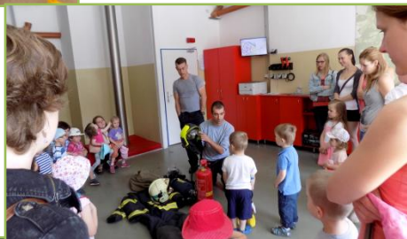
Exkurze u hasičů