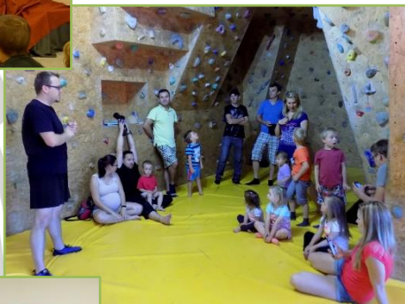
Spidermanův-den 19. 6. 2017