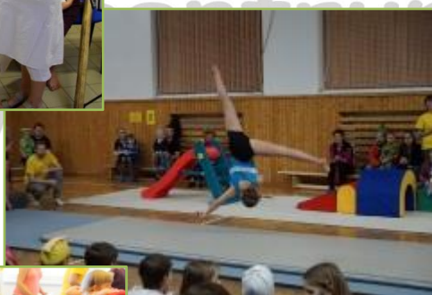
Karneval 28. 1. 2017