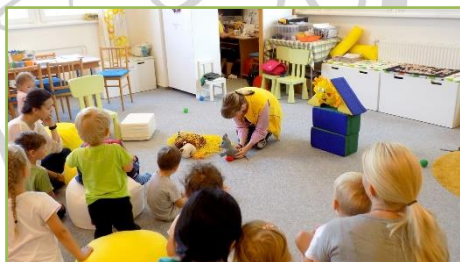
Pohádka s Kájou

Jedná se o verbální aktivitu, při které lektorka vybírá vhodnou ukázkou a setkání vede. Náplní je hlasitá četba vybraného textu, společné převyprávění a společné povídání o tématu. Rodiče tak mají možnost věnovat dítěti soustředěnou pozornost a učí se u dětí rozvíjet schopnost spolupráce. Zároveň získávají podněty k výběru vhodné stimulace rozšiřování slovní zásoby, jak procvičovat porozumění textu i jakou literaturu vybírat, aby byla pro děti srozumitelná, bezpečná a motivující. Při společném čtení se setkáváme jednou týdně, v roce 2017 to bylo celkem 27 setkání, průměrná účast byla 12 rodičů s dětmi.