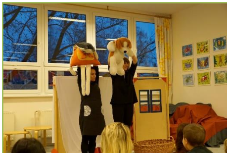
Pohádka Jak pesek s kočičkou myli podlahu