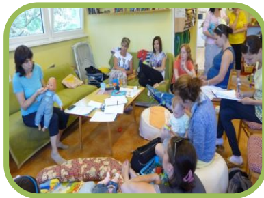
První pomoc u dětí