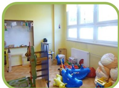
Komunitní místnost - vyklízíme