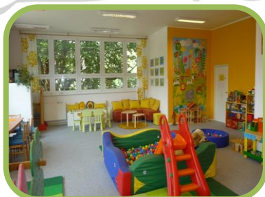
Komunitní místnost – máme hotovo ☺