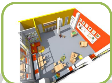
Komunitní místnost – 3D návrh