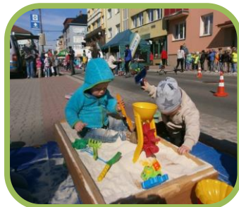
Den bez aut

Fórum s občany města, Ovčácký den na Santově, hudební festivaly Amfolkfest a Starý dobrý western, Den bez aut, Zahradní slavnost Climax a Austin, Sokolení.