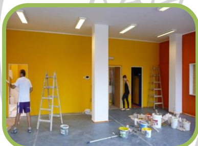
Komunitní místnost – malujeme