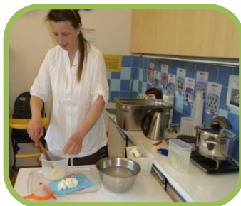
Výroba domácích sýrů